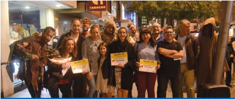
Entrega de premios escaparatismo con temática Halloween