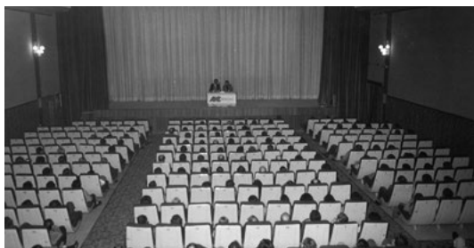
Primera conferencia organizada por Aico impartida por el Catedrático de Derecho Mercantil D. Manuel Broseta en el cine Capitol el 13 de marzo de 1977

Como en todas las Asociaciones y Organismos, AICO ha pasado por sus tiempos de bonanza y sus tiempos de crisis. En éstos últimos hemos de agradecer a los comerciantes con inquietudes e inconformistas, que no dejaron de creer en el ASOCIACIONISMO. A estos Comerciantes, a las juntas directivas y sobre todo a sus cabezas visibles, los presidentes, debemos en mayor parte el poder contar hoy con una asociación fuerte y dinámica.