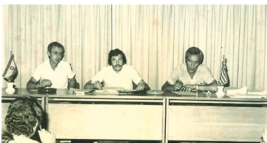
Primera Asamblea General celebrada en 1977

● En 1975 empiezan de forma clandestina las primeras reuniones para formar una Asociación de Comerciantes democrática en Benidorm, ante el desconcierto de muchos de ellos por el reparto del pago de impuestos y cargas fiscales gestionado por la sección de Comercio del Sindicato Vertical franquista, y que deseaban que esos pagos de impuestos se hicieran de una forma más transparente y democrática. Sumando, a todo ello, la explosión de la competencia desleal en la modalidad de venta ambulante en la ciudad, surgieron los primeros argumentos para crear una nueva asociación de comerciantes que fuera INDEPENDIENTE en todos los sentidos.