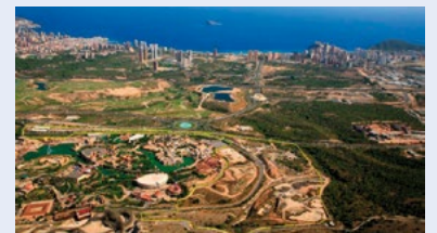
Término municipal en donde se pueden implantar varios centros comerciales, incluido el futuro plan Armanello.

● Ante las acciones del equipo de Gobierno Municipal sobre la modificación puntual nº 19 del PGMO de Benidorm (art.112 de las Normas Urbanísticas), denominada "Grandes Superficies Comerciales" y que conlleva la libre autorización en cualquier parcela del término municipal urbanizable de una posible implantación de más centros comerciales en la ciudad, la Junta Directiva ha trabajado intensamente para conocer los motivos y las razones de dicha modificación sin conocerla, sorprendidos nuevamente por la actuación municipal en la que no ha tenido en cuenta la opinión del Comercio y tampoco conocemos el objetivo final de esta medida. Por tal motivo hemos querido trasladar nuestro rechazo a tal aprobación y la falta de un proyecto de futuro sobre el sector comercial en Benidorm y, por tanto, hemos presentando las pertinentes alegaciones sobre dicha modificación, detectando un gravísimo defecto de procedimiento y que estamos estudiando acudir a los Tribunales